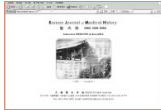
의사학 ( http://medhist.kams.or.kr )