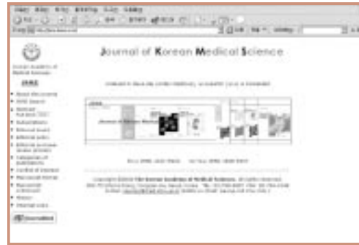
J Korean Med Sci ( http://jkms.kams.or.kr )

현재 KoreaMed Central 서비스에 참여하고 있는 학술지는 총 3종입니다(아래 3개의 학술지 초기화면 참조). 관심있는 학회들의 많은 참여를 바라며, 서비스를 희망하는 학회는 본 협의회의 KoreaMed 담당자에게 문의하시기 바랍니다.