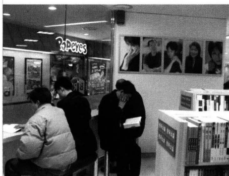
직장인들이 편하게 앉아서 책을 볼 수 있도록 만든 휴게 시설.