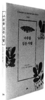
《나를 심은 사람》 장 지오노 지음 | 김경은 옮김 | 두레 | 135쪽 | 값 6,500원

이 책에 나오는 나무를 심는 노인은 자신에 대한 믿음이 매우 강한 사람입니다. 그는 아무도 알아주지 않고 봐주지 않는데도, 혼자서 황무지에 나무 씨앗을 심어 그곳을 낙원으로 바꾸었지요. 새학년을 맞아 마음가짐을 새롭게 하는 3월에 학생들에게 다시 한 번 이 책을 읽혀, 아이들이 자신에 대한 믿음을 견고히 다질 수 있게 하는 것도 좋을 것 같습니다.