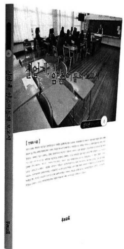
《실업계, 암순이들의 보고서》 안재희 지음 | 우리교육 | 144쪽 | 값 7,000원