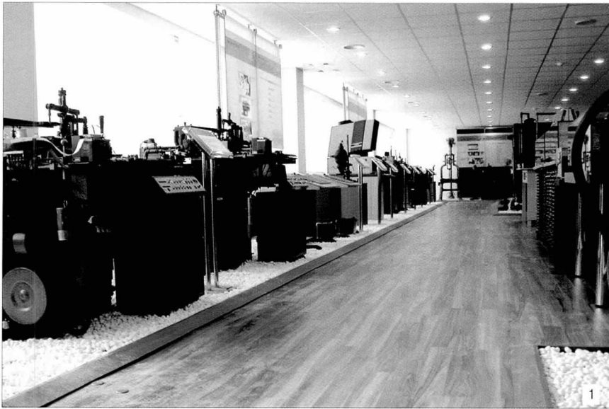
1. 해방이후의 인쇄기계를 전시한 고인쇄기계 전시실 전경 2. 교과서 변천과정을 보여주는 전시실 3. 지난 9월24일 열렸던 교과서박물관 개관식에서 서범석 교육인적자원부 차관이 축사를 하는 모습.