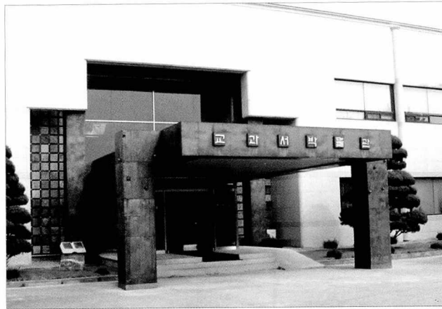
우리나라의 교과서 발전사 및 제작과정을 한눈에 살펴볼 수 있는 교과서 박물관이 지난 9월24일 문을 열었다. 사진은 교과서 박물관 외관 모습. 맨위사진은 교과서번천과정을 보여주는 전시장 모습.

실제로 교과서가 인쇄 및 제본 과정을 거쳐 완성되는 과정을 가까이에서 확인할 수 있어 교과서는 물론 인쇄에 대한 관람객들의 호기심을 십분 충족시킬 것으로 기대된다.