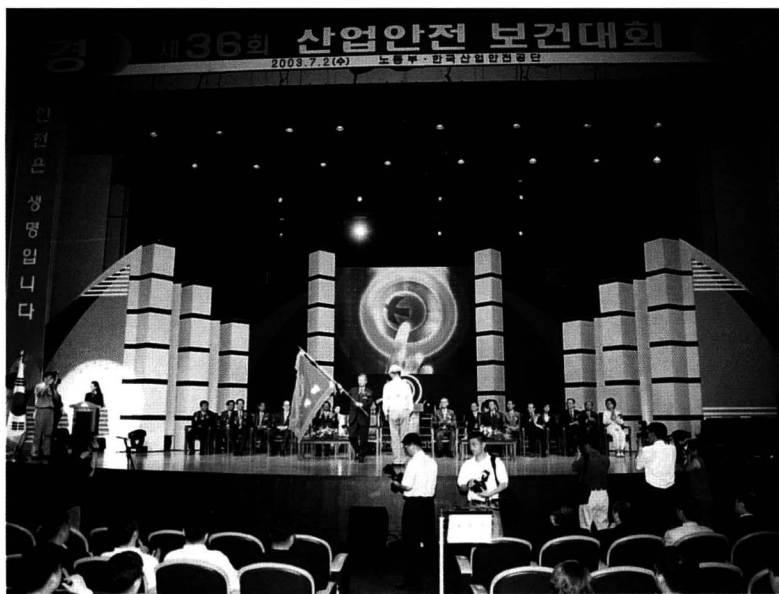
한국산업안전공단 이사장이 무재해기를 흔드는 모습