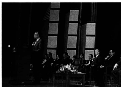
권기홍 노동부장관의 치사