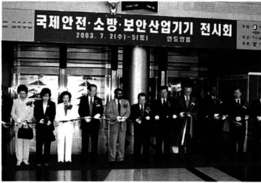
국제 안전보건기기 전시회 개막 커팅 장면