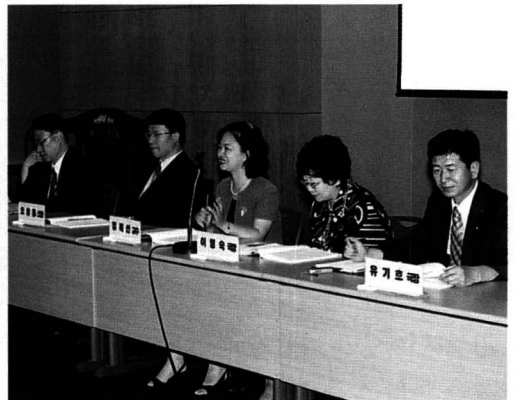
질의 및 토론.