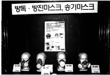
유독가스를 막아주는 마스크, 안전보건제품 전시