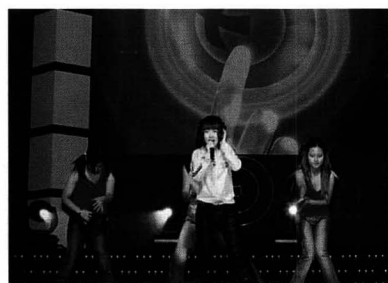
'산업안전보건대회 2부행사'에 출연한 가수, 자주의 열창무대