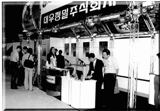
▲ 각종 개인화기를 선보인 대우정밀(주)은 특히 노리쇠와 탄창이 모두 개머리판에 들어가는 bullpup 방식의 차세대 소총 DAR21을 전시하였다.

▼ 한국방위산업진흥회는 조직 및 기능 등을 소개하고 불참업체의 카달로그 등을 전시해 국내 방위산업을 홍보하였다.