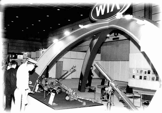
▼화포 전문 생산업체인 위아(주)는 KH179 견인 곡사포와 신형 81밀리 박격포, 4.2인치 박격포, 106밀리 무반동총 등을 선보였다.