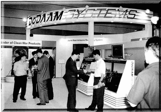
▲ 군용 시뮬레이터와 소프트웨어 전문생산업체인 도담 시스템스는 무인추적사격통제장치, 항공기 디지털 영상기록장비 등을 소개하였다.

▼ 특장차 전문 제조업체인 신정개발은 차량 1대에 버켓, 지게, 제설, 브러쉬 장비 등을 장착해 여러 가지 목적에 쓰일 수 있는 다목적 작업차를 공개하였다.