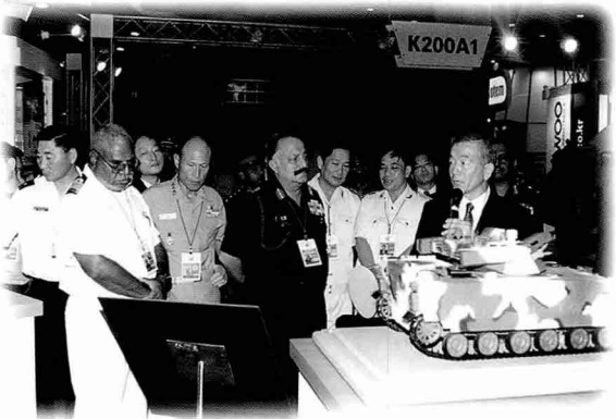
▼30밀리 자주대공포 비호와 지대공 유도무기 천마 등 각종 장갑차를 전시한 대우종합기계