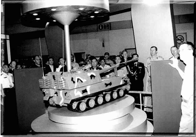
▶ 삼성테크윈은 세계 최고성능의 K9 자주포와 포병사격 지휘차, 해병 상륙 돌격 장갑차 등을 전시하였다.

▶ LG이노텍은 국산 휴대용 지대공 유도무기 ▶ 신궁(수출명 Chiron)과 모의훈련기, 어뢰, 대공유도무기, 정보/전자전 장비 등을 전시하였다.