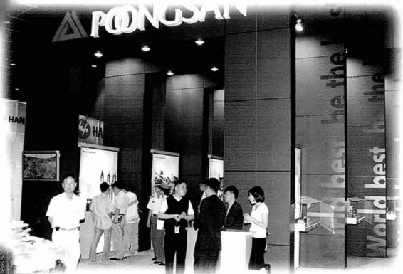
▼풍산은 각종 소구경탄, 함포탄, 대공포탄, 박격포탄, 곡사포탄, 30밀리 골커피탄과 추진화약, 정밀 단조품 등을 전시하였다.