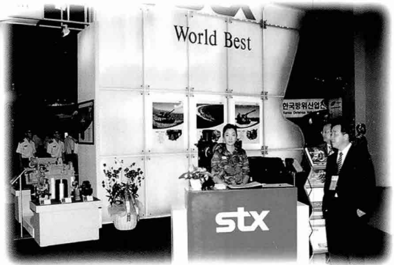
▼디젤 엔진 전문 생산업체인 STX는 K1A1과 자주포에 장착되는 엔진과 선박용 엔진을 전시하였다.