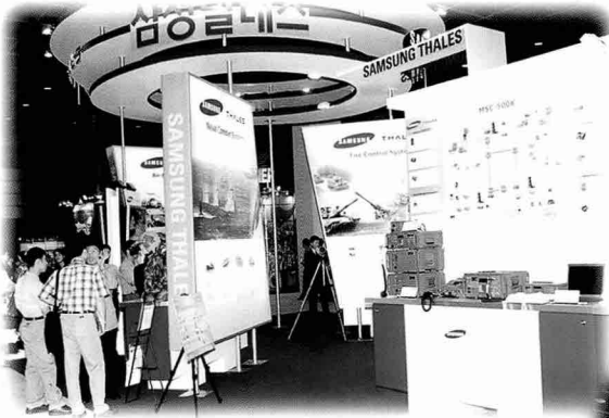
▲첨단 방산전자 시스템 전문업체인 삼성탈레스는 차기 전술통신체계, 무인항공기용 전자광학추적장치, 비 냉각형 열상장비, 사격통제장치 등을 전시하였다.