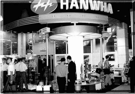
▲한화는 227밀리 다연장탄, 2.7인치 로켓탄, 40밀리 유탄, 수류탄 및 각종 박격포탄 등을 전시하였다.

▼(주)로우테크놀로지는 쌍방 교전훈련을 가능케 하는 레이저 교전훈련장비 MILES와 소화기 야간표적 지시기 등을 전시해 큰 호응을 얻었다.