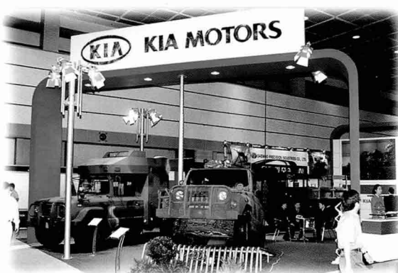
▲군용 차량 전문업체인 기아는 1톤 차량과 1.5톤 의무차량 2.5톤 군용트럭 등을 전시하였다.