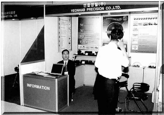
▲연합정밀은 MS-컨넥터, 군용 케이블 및 와이어, EMI 케이블 어셈블리 등을 전시하였다.

▼엠텍은 무인항공기 통신체계, 전파탐지레이더, 군 위성통신체계 등을 전시하여 참관자에게 많은 호응을 얻었다.