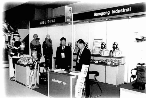
▲화생방 장비 전문 생산업체인 삼공물산은 K-1 방독면, 국민방독면, 화생방 침투성 보호의 등을 소개하였다.