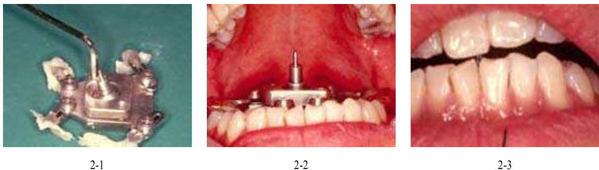
Fig. 2. Placement of device in the mouth and recordings of positions.