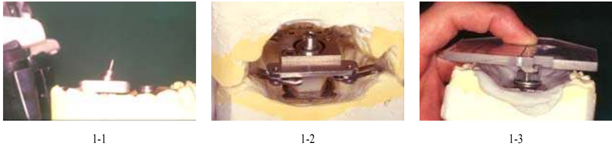
Fig. 1. Steps for setting of the recording plate and recording stylus on the maxillary and mandibular casts.