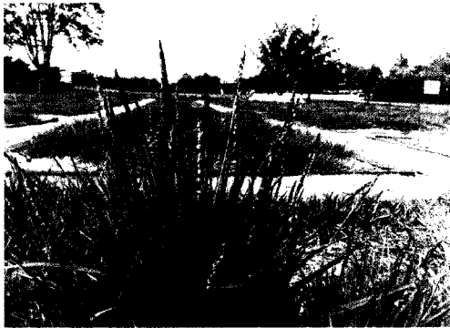
Fig. 4. J01105, superior line for seed.

수집된 한국잔디 133계통 중에서 출수를 하여 종자를 채종한 계통은 88계통이었고, 나머지 45계통들은 출수를 하지 않았다. 출수한 계통들 중에서 종자의 무게가 가장 많이 나가는 계통은 J01021 과 J01119로 종자 1립당 평균 1.34g 이었고, 가장 적게 나가는 계통은 종자 1립당 평균 0.01g이하를 나타내었다. 수집된 계통들 중에서 이삭당 종자의 수가 가장 많은 계통은 J01105으로 이삭당 평균 71.4립이었으며, 이 계통은 종자번식을 위한 육성계통으로 활용할 가치가 높다고 하겠다(Fig. 4).