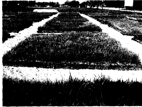
Fig. 2. J01067, superior line for green period.

본 연구에 사용된 수집된 133계통들 중에서 우수한 6계통들의 주요 생육특성 결과를 Table 1에 종합하였다. 우수계통으로 선발된 기준은 밀도(품질), 피복성, 녹색기간, 내병성, 출수유무(종자수) 등의 주요특성과 그 외 생육특성들을 종합하여 선발하였다. 수집된 133계통들 중에서 가장 녹색기간이 긴 계통은 J01067으로 11월초까지 녹색도를 유지하였으며, 특이한 사항은 포복경의 줄기색깔이 보통의 경우는 적갈색을 띠나 이 계통의 경우는 녹색을 나타내었다(Fig. 2). J01106 및 J01129 계통들의 경우는 한국 잔디품종인 건희와 비슷한 생육특성을 나타내었다. 이 계통은 엽폭이 각각 1.5mm 및 2mm 정도로 매우 좁으며, 밀도가 높고, 피복성도 좋은 것으로 나타났으며, 내병성도 강해서 고품질의 잔디로서 이용되면 좋을 것으로 사료된다. J01106 계통은 김두환 등(2000)의 세엽 한국잔디류 신품종 건희(Konhee)의 육성 보고에 나타난 건희(Konhee)의 생육특성과 비슷하여 엽이 세엽이고 밀도가 높은 고품질의 잔디이었다(Fig. 3).