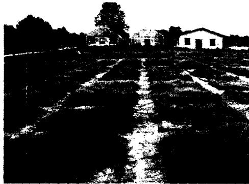
Fig. 1. Experimental field for Zoysiagrass.

2001년 수집된 한국잔디 133계통들 중에는 101계통이 삼성에버랜드 잔디환경연구소로부터 수집되었으며, 나머지 32계통은 전국의 여러지역을 돌며 수집되었다. 수집된 계통들은 2002년 4월초 축산기술연구소 축산기술부(수원)의 잔디시험포장에서 홀커터기(지름10cm)로 채취된 양만큼인 1.8×1.8m 2 의 격자관내에 이식되었다(Fig. 1). 한국잔디의 시비량은 수집되어 시험포에 이식된 1년차인 2002년도에는 시비 및 농약은 일체하지 않았으며, 2년차인 2003년도에는 복합비료 N-P 2 O 5 -K 2 O = 210-150-180(kg/ha)를 4월부터 10월까지 매월 m 2 당 30g 씩 시비하였다.