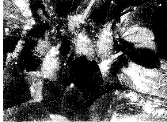
Figure 3. The fruits of Rhododendron tschonoskii