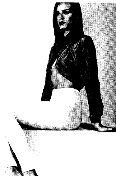
Fig. 5. Drawers 2(Wacoal, 2002. imort brand collection)

밀착된 스타일의 보건 위생적인 기능으로 남아있으며 감각적이기보다는 실용적이다(Fig. 5).