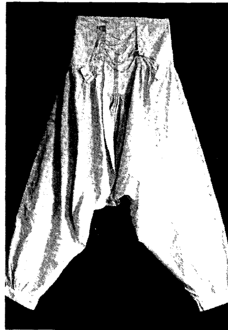
Fig. 3. Lawn Drawers (이의정 · 김소영, 2001. 언더웨어. p.83)

오늘날 브리프(brief)로 언급되는 B.C 3000 년경의 슈메리아의 테라코타(terra cotta)상은 현재