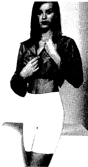
Fig. 4. Drawers 1(Wacoal, 2002. imort brand collection)