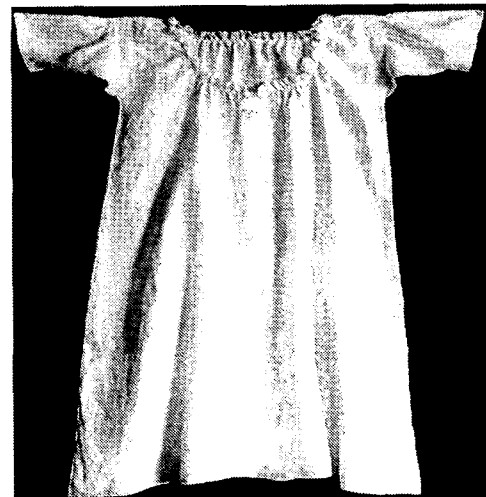
Fig. 1. Linnen Chemise (김기업. 1985. Gothic 시대의 남녀복식에 관한 연구)

슈미즈(chemise)는 어깨에서 늘어뜨려 동부(胸部)를 풍성하게 감싸는 허벅다리 길이의 여성용 속옷이다. 어원은 라틴어의 카미시(camisia: 아마제 셔츠의 뜻)이고, 12세기경 셔츠를 뜻하는 프랑스 어인 슈미즈로 바뀌었다. 슈미즈는 처음에는 린넨 옷감을 의미하였지만, 그 후 린넨으로 만든 속옷을 지칭하는 말로 되었다(정홍숙, 1985). 형태적으로 고대의 튜닉(tunic)으로부터 발달하여 스모크(Smock)로 발전된 뒤 슈미즈로 되었다(Fig. 1). 중세후기 내외로서 사용된 슈미즈는 얇은 麻, 絹 등으로 만들었고 목둘레, 소매둘레에 자수나 레이스로 장식하였다. 르네상스 시대에