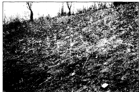
그림 2. 콘크리트 호안블록 식생피복공 재시공 현장(2003. 4)

의 식재종인 개나리, 현사시나무를 비롯하여 쇠무릎, 나팔꽃, 엉겅퀴, 달맞이꽃, 쇠뜨기, 사철쑥, 접시꽃, 명아주, 미국가막사리, 머느리배꼽, 마, 애기똥풀, 방가지똥, 사데풀, 서양민들레, 개밀 등이 자라고 있으며 고수부지와 고수호안 모두 자라는 종은 소리쟁이, 쑥부쟁이, 강아지풀, 참억새, 박주가리, 개망초, 망초, 벌꽃, 쇠벌꽃, 쑥부쟁이, 돼지풀, 여뀌, 깨풀, 석잠풀, 닭의장풀, 애기매꽃, 열치기완두, 돌콩, 다닥쟁이 등이며 이 종들 중 저수호안의 갯버들, 짚레꽃, 고수부지의 벌개미취, 양지꽃, 수크령과 고수호안의 개나리, 그리고 고수부지, 고수호안 모두 출현하는 쑥부쟁이와 물억새를 제외하고는 모두 공사 후 출현종으로서 호안단면의 생태계 교란이 심한 것을 알 수 있었다. 실제로 벨트-트랜섹트(belt-transect)조사구 설치시 대부분이 고수호안인 우안은 식생피복공사를 재시공하여서 재시공한 곳을 제외한 지점에서 조사구를 설치해야 하므로 위치선정의 제약이 있었고 벨트-트랜섹트(belt-transect) 설치한 두 곳 중 한 곳도 우안의 고수부지가 나대지로 방치돼 있어 인간에 의한 훼손이 심한 것을 알 수 있었다.