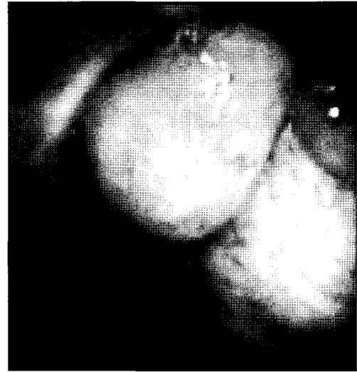
Fig. 3. Broncoscopic findings. A large pedunculated mass was occluded in the orifice of right upper lobe bronchus.

다(Fig. 3). 종괴는 표면이 딱딱하고 출혈이 유발될 위험성이 있어 조직검사는 시행하지 못하였다. 환자의 나이와 흡연력을 고려하여, 악성종양일 가능성을 배제하기 위한