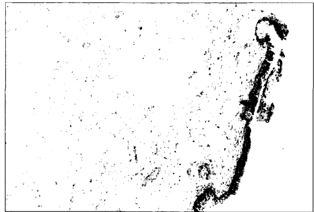
Fig. 4. Pathologic findings: An endobronchial polypoid lesion consists of the mixture of fibromyxoid stroma and fat with respiratory epithelial covering. No cartilage is found (H&E, \times 100 ).