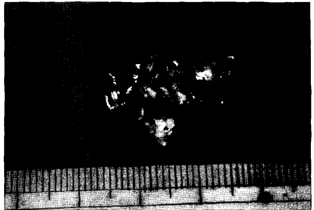
Fig. 3. Endobronchial mass was completely removed in two large pieces with wire snare and electrocauterization.