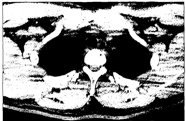
Fig. 4. Chest CT finding shows round mass (1.5 cm in diameter) is located in the mid-trachea with its hypodensity similar to the fatty tissue.

SD-7C, Olympus optical co. Tokyo, Japan)를 유도하여 기관 내로 유치한 다음 L-tube를 비강 밖으로 제거한다. 경구를 통하여 기관지내시경을 기관 내로 유도한 다음 snare wire를 종양의 경부(pedunculated part) 또는 다구형 종양(lobulated tumor)의 협부에 기관지경직시하에 wire snare를 위치한다. 기관지경직시하에 wire snare에 의한 정상조직손상 가능성을 고려하면서 서서히 wire snare를 조이면서 동시에 electrocautery를 간헐적으로 적용함으로써 출혈에 방이 가능하였고, 종양적출을 용이하게 하였다(Fig. 2). 또한 동시에 종양의 일부를 생검용 forceps으로 잡아 절제된 종양을 내시경과 함께 밖으로 제거하였고, 필요에 따라 같은 조작을 반복하고, 남은 조직은 다양한 크기의 생검 forcep으로 제거하였다(Fig. 3). 절제한 조직의 일부를 fro-