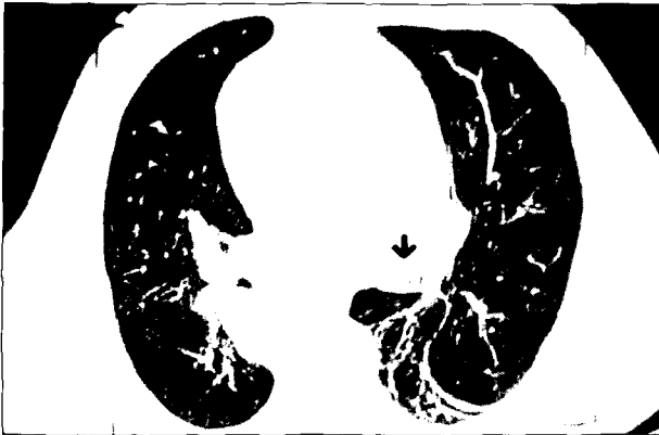
Fig. 1. Endobronchial mass (1.2 cm in diameter) was located in the intermediate bronchus on chest CT scan.