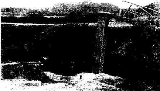
사진 2 경남 함안군 백산제 수해현황 (2002. 8월 집중호우로 인한 피해)