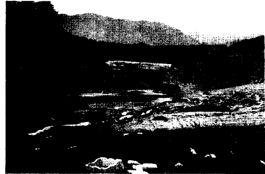
사진 1 강원 강릉시 장현저수지 붕괴모습 (2002년 태풍 루사로 인한 피해)

장 실무자를 대상으로 실시한 설문조사결과에 따르면(02. 12), 개량복구보다는 원상복구에 치중, 저지대 내수침수방지대책 부족 및 예산부족으로 인한 수해예방사업 지연 등을 수해재발 원인으로 지적하였다.