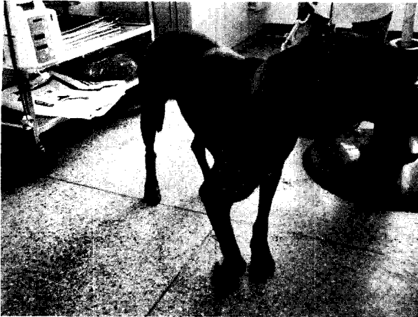
Fig 1. Mixed, 13 years old, male; lameness and paresis in the right thoracic limb. Note the fixed carpal joint of the right thoracic limb, and a soft tissue mass is protruded at the cranio-lateral scapula