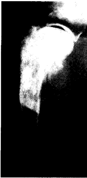
Fig 2. A lateral radiograph of the proximal humerus. There is bony proliferation and lysis noted in the proximal humeral metaphysis. There is irregular, amorphous soft tissue mineralization surrounding these bone.

할 수 있었다 (Fig 2). 폐장 내 전이 여부를 확인하기 위한 X-선 검사에서 특이 소견은 발견되지 않았다. 비장과 간장 내 전이 여부를 확인하기 위해 컬러 초음파 검사를 실시하였지만 전이와 관련된 소견은 확인되지 않았다.