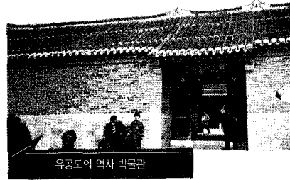
유공도의 역사 박물관

과연 거리에는 중국의 수병들이 대열을 맞춰 행진하는 모습도 보이고, 수병들의 막사도 보인다. 민간인에게 개방되는 곳은 유공도의 해안의 일부이다.