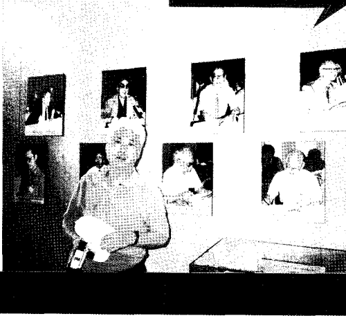
청일전쟁에 대해 심포지엄하던 학자들의 사진일에서

회의 말미에 중국 측 인사들은 한국을 성토했다. '너희 한국은 무조건 미국 편을 드는데 앞으로 그렇게 하면 재미없을 줄알라는 것이 그 골자였다. 섬뜩한 공갈이었다. 그것도 술자리가 아니고, 맨 정신에 회의용 탁자를 손 바닥으로 내리치며 한 말이다. 이제 개발 도상에 있는 중국의 관리들이 그러하니, 항 후 더욱 국력이 커지면 어떻게 나올 것인가. 그 점이 무척 염려스럽다.