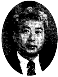
글. 홍하상 /MBC 다큐멘터리 작가/

중국에 대해 관심을 갖는 것은 이것이 전부가 아니다. 우리가 두려워하는 것은 '중국이 향후 어떻게 나올 것인가'이다. 경제가 최고 상승세 이르는 2015-25년 경, 중국은 우리에게 무얼 요구할 것인가가 문제이다.