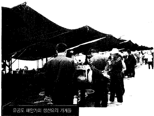
유공도 해안가의 생선요리 가게들

다음 날 나그네는 웨이하이시에서 황해바다 쪽으로 15 분 떨어진 유공도엘 갔다. 유공도는 라오닝성(요녕성)의 여순시와 함께 중국 최대 의 군사항구이다. 1894년 청일전쟁 때, 청국의 함대가 황해로 발진했던 곳 이 유공도이다. 나그네는 유공도엘 꼭 한 번 가보고 싶 었다. 청일전쟁에 대해서 10년 전부터 관심을 가지고 있었기 때문이다. 유공도에 내리니, 시장판이다. 섬 인근의 바다에서 잡아온 해산물로 난전을 펴고 있 다. 이제는 중국 최대의 해군기지가 아니라 경치가 좋 은 관광지가 되었기 때문이다. 유공도에는 곳곳에 중국의 군함기지가 있다.