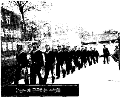
유공도에 근무하는 수병들