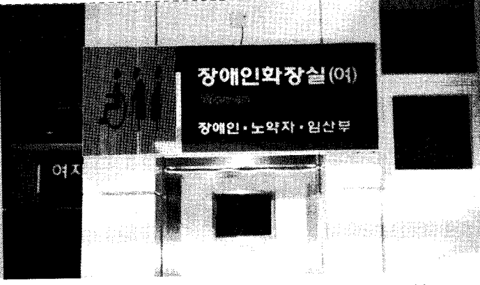
▲ 아무리 생각해 보아도 "장애인 화장실"보다는 "다목적 화장실"로 바꾸는 것이 좋을 듯 하다 군성(하)휴게소

둘째, 아직은 개통된 지 얼마 안되는 관계로 이용자 숫자에 비하여 화장실이 너무 크고, 부스가 너무 많다는 느낌이 들었다. 다시 설계를 할 때에는 경우에 따라 일부만 사용할 수 있도록 설계 상의 기술을 발휘, 한적한 시간대에는 일부만 사용할 수 있도록 하면 더욱 좋겠다는 생각이 들었다.(물론 그렇게 되면 에너지 절약 등 유지관리에도 도움이 된다.)