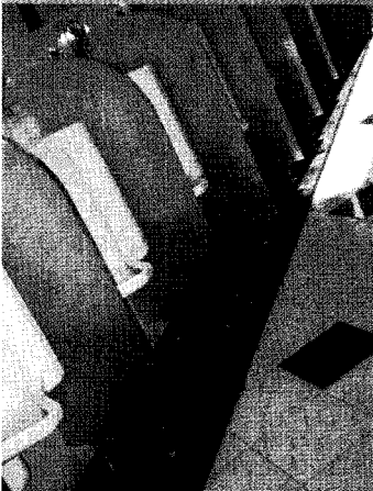
▲ 소변기 앞에 약간 턱이 있는 넓은 대리석을 깔아, 소변기에 바짝 다가갈 수 있도록 유도하고 있다. 군산(상)휴게소

전체적인 느낌은 고속도로 자체도 이미 사용되어지고 있는 다른 고속도로에 비하여 직선으로 길게 연결된 것이 시원한 느낌을 준 것처럼, 모든 휴게소 건물이 새롭게 지어져 깨끗하고 여유스러웠으며, 따라서 화장실의 공간·설비 등도 건물에 걸맞게 우수 하였으며, 유지관리 또한 열심히 하고 있는 느낌을 받았다. 예를 들어 모든 화장실은 전체적으로 휴게소 입구쪽(건물을 바라보고 오른쪽)의 동일한 장소에 위치하고 있었으며, 넓은 실내에는 유리벽과 천창(Top Light)을 설치하여 조명을 위한 에너지 절약과 배기기능 그리고 밝은 느낌을 주고 있었다. 실내 한 쪽 공간에는 예외 없이 실내 정원이 만들어져 여행객의 피로를 덜어주려는 노력도 돋보였다. 서산휴게소(하)의 경우는 화장실 접근 시까지 턱을 찾을 수 없도록 완만한 경사로 외부 바닥을 마감했으며, 군산(하)에는 장애인 주차장이 화장실 입구 가까운 곳에 설치되어 있었으며(지붕까지 미련되어 비오는 날에 우산을 펴는 번거로움까지 해결해 주고 있었음), 특히 이곳 화장실의 세면대 거울은 크지 않으면서도 이용에 불편이 없도록 설치되어 있어 유지관리하기에도 편리하도록 되어 있었다. 고창, 고인돌(상) 휴게소의 어린이용 소변·대변기가 설치되어 있는 공간은 노란색 벽 타일이 양장스러운 소아용 변기 모형과 아주 좋은 색조를 연출하고 있었으며, 군산(상)의 소변기 앞에는 약간 높은 턱의 넓은 대리석을 깔아 사용자가 소변기에 바짝 다가서서 용무를 볼 수 있도록 자연스럽게 유도한 배려 등이 특히 눈에 띄었다. 아울러, 화장실을 중심으로 하여 마음먹고 달려본 천리 길이기에 몇 가지 주문을 덧붙이자면, 첫째 화장실 위치는 통일되어 있어 익숙한 여행객에게는 큰 문제가 없겠지만, 휴게소에 들어서면 멀리서도 눈에 띄 수 있는 화장실 표시 픽토그램을 적당한 위치에 설치해 놓으면 편리하겠다는 생각이 들었다.