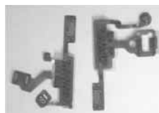
▲ 0903 & 0415