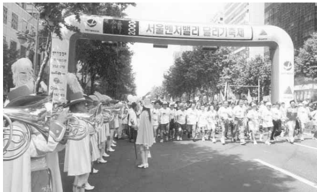
▲ 제1회 서울벤처밸리 달리기 대회 장면

※ 추후 변동사항 및 일정은 공식홈페이지(www.venturekorea.org)에서 확인 바랍니다.