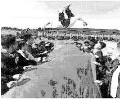
▲ 통천릴레이 장면