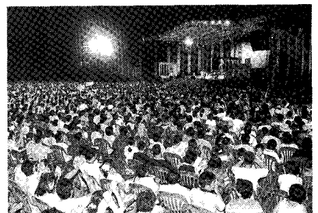
▲ 제7회 전국대회 '환영의 밤' 행사 장면