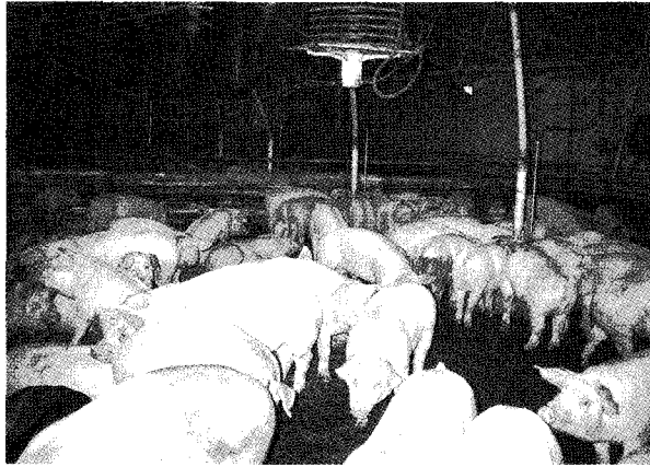
▲ 새로운 돈군 도입을 위해서는 여러 농장에서 들여오는 것은 아주 위험한 일이며, 가급적 한농장의 돼지를 도입해야 한다. 또한 도입시 반드시 몇가지 질병에 대한 오염여부를 확인하고, 이를 보장받아야 한다.

획, 후보돈 입식계획 등), 자금 운용계획, 자금조달계획, 판매계획, 인력계획, 방역계획 등을 잘 만들어 전체적인 경영계획이 완성되게 하고, 이에 따라 수행한다면 성공적인 돈군의 재조성을 할 수 있을 것이다.