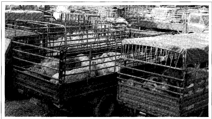
▲중국에서 생산되는 돼지고기는 대부분 국내에서 소비되며, 98년도 1인당 연간 육류소비량 40.1kg 중 돼지고기가 26.3kg로 66%를 차지하고 해마다 소비량은 증가하나 그비율은 감소되고 있다.<사진은 국내 도축장 출하 모습>

한편 돈육수입량은 4만톤(1998년) 정도로 극히 적은 량이다. 중국의 WTO가입 이후 정부나 농민들의 수출에 대한 기대가 큰 상태이나 방역문제 등 국가간 존재하는 축산물 무역의 특수상황이 단기간 해결되기는 쉽지 않기 때문에 당장 생육형태의 돈육수출·입증가는 예상하기 힘들다. 그러나, 심각한 중국의 농업문제를 해결하고자 중국 정부는 한국을 비롯한 주변국에 대한 농산물 수입압력을 높여 갈 것으로 보여 가금육뿐 아니라 돼지고기 분야에서의 무역분쟁도 커질 것으로 보인다. 양돈