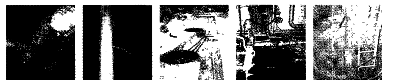
■탱크청소공사 ■탱크내부라이닝 ■탱크 및 배관보수 ■유류사고 긴급보수 ■탱크 용도제자공사