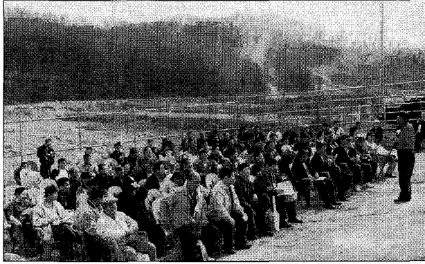
▲ 종합 토론 시간.

난 후에는 종합 토론 시간을 마련, 농가들이 그동안 농장을 운영하며 궁금했던 점들에 대해 질문을 받고 답변을 하는 시간을 마련하는 등 보다 효율적이고