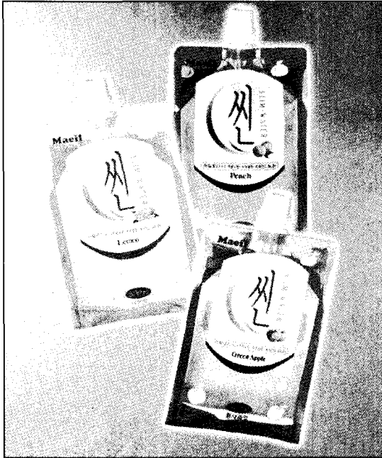
[사진 1] 스파우트 파우치 포장의 썬 제품