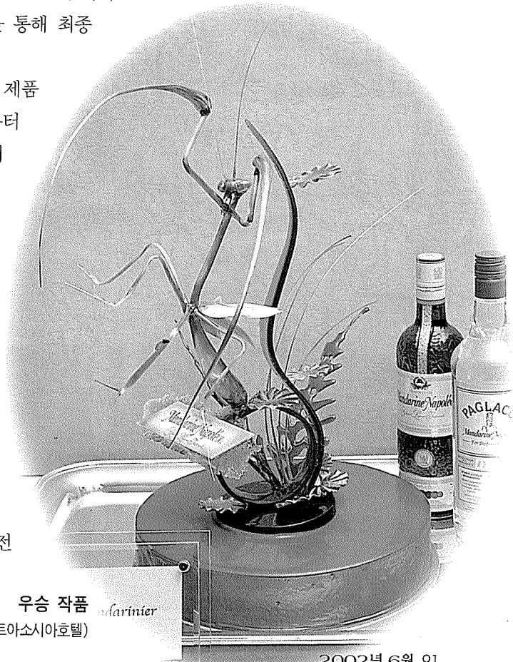
우승 작품 Mandarinier 櫻 智行 (名古屋 마리오프아소시아호텔)

이번 대회의 우승은 나고야(名古屋) 마리오프아소시아호텔 소속의 櫻 智行씨에게 돌아갔으며, 이밖에도 2차 실기 경연에 참가한 전원에게 순위별로 상패가 수여됐다. 이번 대회에서 우승한 櫻 智行씨는 2003년 선발되는 우승자와 재경합을 벌여 벨기에 브뤼셀에서 열리는 ‘만다린 나폴레옹 콘테스트’ 본선에 출전하게 된다. <취재 / 허미경 jpkjong@mbakery.co.kr>