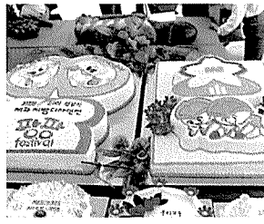
케이크 대상/분당 상제르망과자점 최순호

성남시지부(지부장 조병희)가 지난해 10월 성남시 울동공원에서 열렸던 제2회 빵·과자디자인전에서 주도적 역할을 했다.