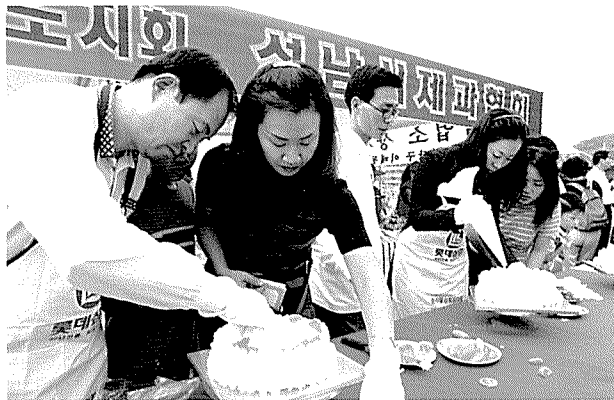
성남시 지부가 실시한 가족 케이크 만들기 행사 한 장면.