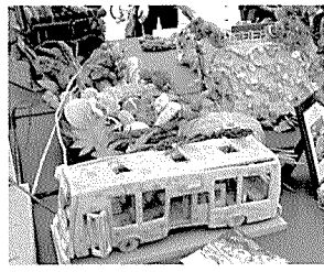
빵공예 대상/분당 폴리앙스과자점 김영옥