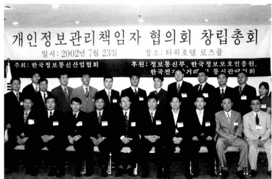
▲ 창립 총회에 참석한 각 업체별 CPO들

해외진출 기반 조성을 위해서는 인터넷산업관련 국내·외 기관과의 협력 및 교류와 해외 민간 자율규제에 대한 현황 조사 등을 할 예정이다.