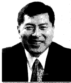
현대카드주식회사 이 상 기 금융, 서비스 서울시 영등포구 여의도동 15-21