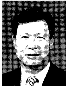
한국로지텍 주식회사 이 주 은 복합화물운송 및 주선 외 서울시 용산구 원효로4가 113-25