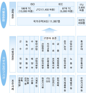
〈그림 1〉 국가표준 추진체계