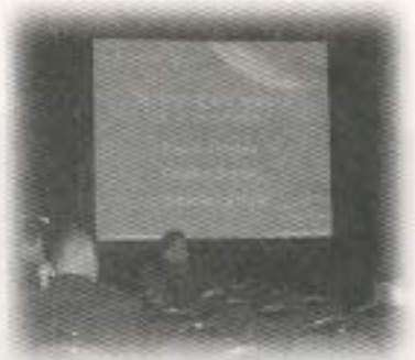
(좌측페이지) WA 3차 총회가 열린 호주 멜버른 컨벤션 센터 중앙홀. (오른쪽) 호주 멜버른 컨벤션 센터 WA 학술 발표 강 내부 (아래) 호주 멜버른 컨벤션 센터 WA 포스터 세션장 내부 (맨아래) 전시장내 Wedeco 부스에 전시중인 UV 소독장비

Water Association), 호주 폐기물 관리 협회:WMAA(Waste Management Association of Australia), 호주 및 뉴질랜드의 청정 공기 사회:CA SANZ (Clean Air Society of Australia and New Zealand), 호주의 환경사업부:EBA(Environment Business Australia)등 총 79개국에서 2900명이 참석한 국제적 규모의 물 관련 행사이다.