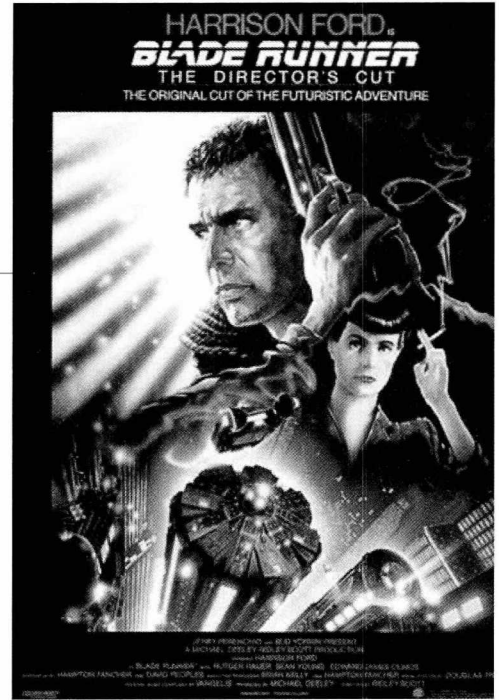
인간과 사유의 문제를 제기했던 SF영화의 걸작 <블레이드 러너>의 포스터.

요즘 영화가 보여주고 있는 두드러진 질문 가운데 하나는 인간의 기억에 관한 것이다. 명확하게 규명할 수 없는, 조작 가능성이 있는 기억, 더 이상 인간적인 진실을 마련해줄 수 없는 기억에 관한