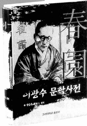
한승욱 편저 고려대출판부/A5신/776면/40,000원

춘원 이광수에 대한 평가는 아직까지도 긍정과 부정이 엇갈리고 있는 실정이다. 그의 친일 행위에 무게를 두는 쪽에서는 아예 변절자로 낙인찍어 그를 백안시하는가 하면, 긍정적인 쪽에서는 다양한 장르에 걸친 문학적 성과, 불교·기독교 등을 아우르는 범종교적인 사상의 깊