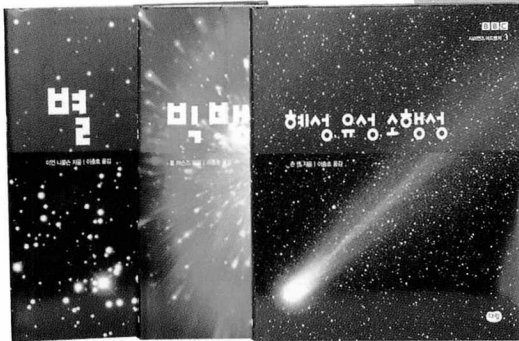
이언 니콜슨 외 지음 | 이충호 옮김 다림/B5변형/각 96면/각 9000원

리를 알아보고 고대문명과 현대문명의 천체관 변천사, 별의 성질과 거리에 따른 밝기, 온도 및 화학적 조성, 폭발하는 별과 그 잔해 등을 정리했다. 《빅뱅》은 우주의 근원적인 탄생을 이야기하고 어떻게 오늘날의 모습으로 변해왔는지 상세하게 알려준다. 아인슈타인의 상대성이론에서 우주의 신비를 풀어낸 빅뱅 이론까지 최신 과학이 밝혀낸 새로운 사실과 정보를 중심으로 소개했다. 빅뱅 이론의 성공과 문제점에 대한 지적도 빼놓지 않았다. 《행성 유성 소행성》은 우주 공간에 존재하는 수많은 운석과 유성, 소행성을 포함한 다양한 천체들의 존재를 설명한다. 특히 태양계를 중심으로 한 별들의 비밀을 물리학적 증거와 이론을 통해 자세히 살핀다. 또 소행성이나 혜성과의 충돌은 이제 모든 인류가 함께 고민하고 풀어야 할 문제라는 점도 일깨워준다.