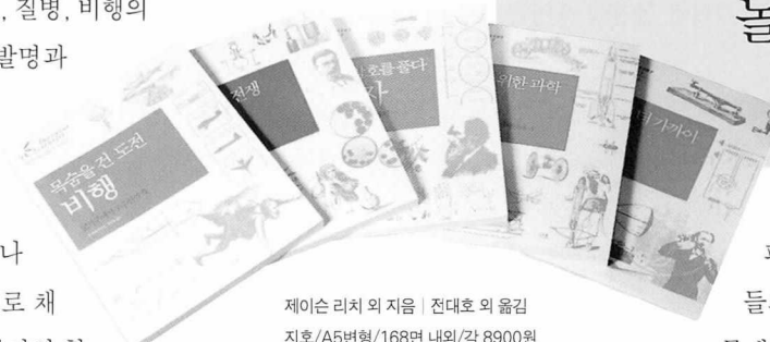
제이슨 리치 외 지음 | 전대호 외 옮김 지호/A5변형/168면 내외/각 8900원

히, 강운재)은 피부에 작은 상처만 생겨도 파고 들어오는 세균과 질병에 대항한 과학자들의 노력과 결실에 관한 이야기다. 작은 미생물에 의해 병이 발생한다는 사실을 확고하게 증