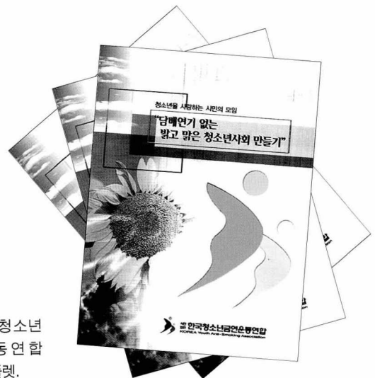
◆ 한국청소년금연운동연합 안내 팸플릿.

한국청소년금연운동연합은 △비흡연 청소년에게 경각심을 일깨워 흡연에 대한 호기심과 욕구를 해소, 일탈과 비행 예방 개념의 건전한 청소년 사회육성 △흡연청소년을 대상으로 담배의 해악을 깨우치도록 지도하여 장기적인 금연생활을 권장, 지원하여 흡연으로 인한 비행적 하위문화 형성 등 종전의 부정적 사례시정 △유해환경 감시개념의 불법 담