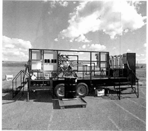
이동식 탄약처리 시스템

Nammo 및 ISL은 Demil 시장을 강화할 것이며, EBV는 최고의 어려움에 도달하였다. 국가단위의 경