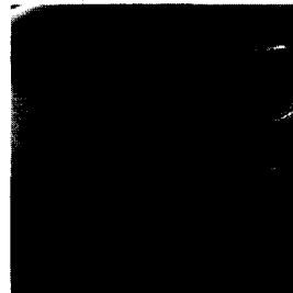
<그림 2> 위계성의 예

이용하여 가변적 개폐방식에 의한 연속성 및 공간의 분절을 추구하고 있고, 사례5의 공용홀 및 사례7의 매장공간에서는 가변적 파티션을 이용하여, 필요에 따라 개방과 폐쇄를 반복·대입시킬 수 있는 구조를 도입하고 있으며, 사례2의 고객전용 공간에서는 수직적 벽체의 부분적인 열림과 닫힘 기법을 통하여 시각적 연속성을 부여하고 있다.