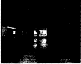
<그림 5> 상보적이원성의 예

사례 2,4,6의 경우에는, 진입 공간에 스크린 가벽을 다양하게 이용함으로써, 동선을 우회적으로 유도하면서 동시에 내부 공간의 시각적 접점에 의한 중첩성을 유도하고 있으며, 꺾여진 주 공간 내부에서는 공간의 분절을 이루는 수직 커가 없이 전체적으로 개방시켜 연속성을 줌으로써, 시야의 조절에 의한 적게 많이 보여주는 기법을 채택하고 있다.