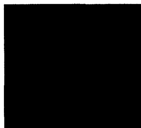
<그림 4> 공간적중층성의 예

사례 1,7에서 나타나는 과정적 공간으로서의 '전이성'은, 인접한 공간의 상호 연결성이 전이 공간과 그 형태와 방향성이 같을 때에는, 기준이 되는 축을 중심으로 일련 연속 배치되는 특성을 보이는데 반해, 사례 3,6의 경우에서처럼, 형태와 방향성이 일치하지 않는 보다 다양한 공간 구성 기법으로 이루어지는 경우에는, 연결 매개 공간이 주공간의 형태와 공간분화를 유도하면서 자신은 매개로서의 역할과 동시에 독자적 영역으로서 독립되어 하나의 주공간이 되는 형태로도 나타났다.