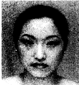
자극물 4(Up to date)