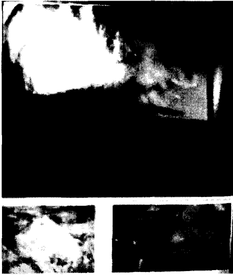
<그림1> 주디스 배리, 죽음을 상상하는 상상력, 1991, 휘트니 미술관 설치

이용한 작품을 보여주는데 노인 마네킹이 성기를 노출한 채 임신된 몸을 흉측스럽게 드러내며 누워 있으므로 해서 예술에 있어 서구 누드화의 젊고, 싱싱한 혈기가 넘치는 젊음 자체의 관심과 매력에 익숙한 우리에게 무능과 쇠퇴라는 부정적 이미지로 각인된 노인의 임신한 누드의 재현을 통해 낮설게 한다. 즉 이상화되지 않은 비천한 신체, 결핍되고 소모된 육체를 과시함으로써 여성적 아름다움이라는 부계 개념에 도전한 것이다.<그림2>