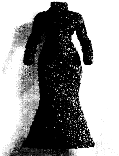
<그림7> 얀 파브레, 육체의 전사, 1995.

여성의 애브젝트를 유발하기 위하여 감상의 거리에 따라 찬란한 옷으로 혹은 징그러운 곤충들의 집합으로 보이게 함으로써 여성 옷에 대한 재현의 틀을 깨고 그의 정체성에 대한 질문을 던진다.<그림7> 얀 파브레 Jan Fabre의 [육체의 전사 Well of The ascending Angels]는 방부 처리된 수만 마리의 곤충으로 재목에서 은유 하는 것처럼 전사의 갑옷과 같은 여성의 옷을 보여준다.