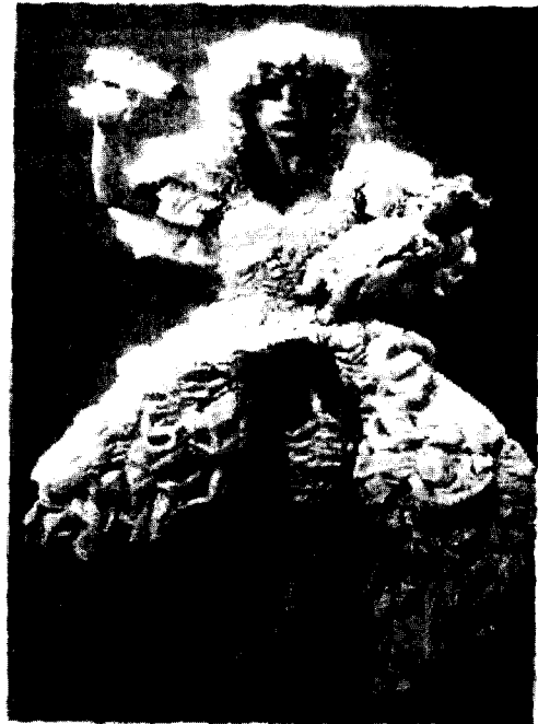
<그림11> 폴레트, 어머니상, 1981.

일단 여성 패션이 여성의 육체를 재현하는 분야로 지목되면 그것은 지배 문화가 어떻게 여성성을 구성하는가, 그리고 재현이 여성에게 어떻게 전달되는가에 대한 중요한 텍스트가 된다. 16) 기존의 남성적 이데올로기에서 여성에게 부여된 아이러니한 이미지는 현모양처의 도덕성과 요부로서의 성적매력이 요구되는 이 사회의 딜레마를 표현하고 있다.