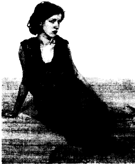
<그림6> 지나스테르박, 바니타스, 1987.

이는 여성의 신체가 우리 시대의 성과_욕망이 대중문화를 매개로 하여 가장 가시적이고 직접적으로 상품화되거나 남성적 관점을 즐기는 매개체가 되고 있는 상황에서 가부장적 권력의 희생양으로써 남성의 성폭력의 대상으로 이용되고 있는 것을 의미한다.<그림6>