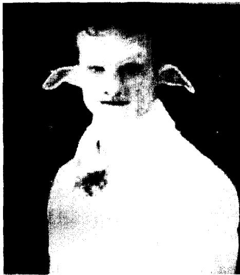
<그림4> 매튜 바니, 크리매스터IV, 1994, 프러덕션 스틸.

남성 작가인 매튜 바니 Matthew Barney는 뛰어난 여성적 외모를 가진 패션 모델 겸 전직 축구 선수였으며 아마추어 동반가 이었다. 작품에서 자주 복장 도착을 통한 양성동체의 모습을 보이는 작가이기도한 그는 1994년 [크리매스터 Cremaster IV]라는 필름에서 <그림4> 자신을 양복 입은 야수로 분장하여 미남으로서의 자신의 정체성을 왜곡시키고, 인간의 신체보다는 인간의 양성성과 동물성의 표출로 기존에 금기 시 되었던 시각적 충격으로 인간의 비천함을 상징하고 있다.