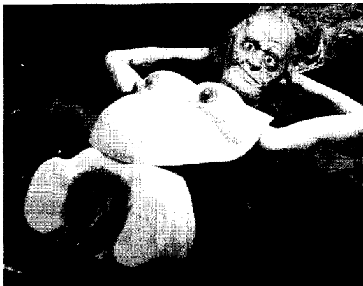
<그림2> 신디셔먼, 무제# 250, 1992.

이용한 작품을 보여주는데 노인 마네킹이 성기를 노출한 채 임신된 몸을 흉측스럽게 드러내며 누워 있으므로 해서 예술에 있어 서구 누드화의 젊고, 싱싱한 혈기가 넘치는 젊음 자체의 관심과 매력에 익숙한 우리에게 무능과 쇠퇴라는 부정적 이미지로 각인된 노인의 임신한 누드의 재현을 통해 낮설게 한다. 즉 이상화되지 않은 비천한 신체, 결핍되고 소모된 육체를 과시함으로써 여성적 아름다움이라는 부계 개념에 도전한 것이다.<그림2>