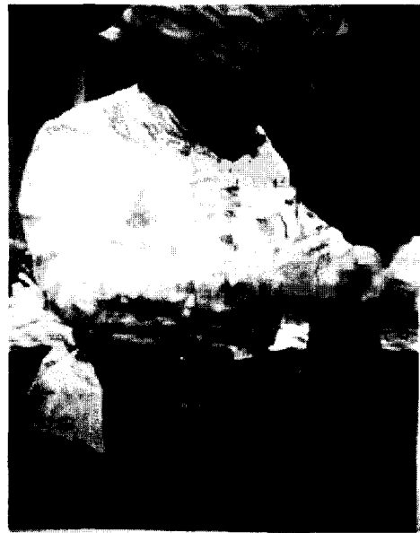
<그림3> 폴 맥카시, 보시버거, 1991, 퍼포먼스.

또한 비천함의 전략과 외설의 재현으로 현대사회의 지배적인 약호와 고정된 성적 정체성을 혼란시키고자 한 폴 맥카시 Paul McCarthy의 퍼포먼스도 테러에 가까울 정도로 그로테스크하여 비디오를 통해 관람되거나 현장에는 소수의 관객만이 초대될 뿐이었다. 그의 「보시 버거 Bossy burger」는 신체의 분비물인 월경과 정액을 신체의 분비물과 유사한 음식물인 케첩과 마요네즈로 그것을 먹고 토하는 그로테스크한 행위를 창출함으로써 사회적 신체 권위에 도전한다.<그림3> 그리고 그는 또 다른 퍼포먼스에서도 여성용 팬티를 입은 채 자신의 성기를 노출하거나 그것에 케첩을 뿌리는 양성 동체적 행위를 통하여 성별 개념을 부인하고, 나아가 인체의 계급 구조적 이분법에 도전하기도 하였다. 13)