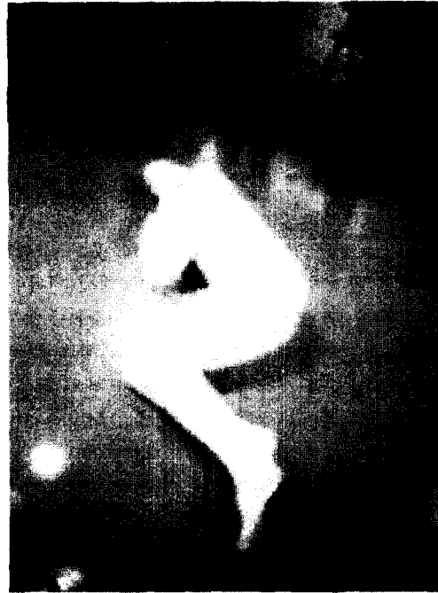
<그림5> 수 윌리엄스, 「참을 수 없음」, 1991.

다른 한편으로는 언어와 만화적 이미지를 이용하여 여성이 이 사회에서 성적인 대상으로만 존재하며 자신이 자신의 신체를 컨트롤 할 수 없음을 고발한 수 윌리엄스 Sue Williams의 작품은 누워 있는 여자의 몸에 현 사회의 성차별에 대한 작가의 발언을 적어 놓음으로써 이는 비천한 신체에 대한 상징계의 언어적 각인임을 시사하고, 가부장적 사회에서 타자로서밖에 존재할 수 없는 여성의 비천함을 재현하였다.<그림5>