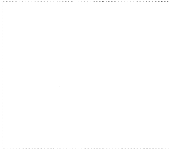
그림 3. 공 주고 받기

이 놀이는 모든 관절의 가동 영역을 넓히고 근육의 어완과 긴장을 반복함으로써 몸을 유연하게 하기 위한 것이다. 유연성은 신체 균형 유지에 필요한 요소이며 조정력의 정도를 지배하는 것이다. 유연성은 아동의 성장과 함께 저하되는데, 근육을 수축시키고 이완시키는 동작을 계속적으로 실시해야한다.