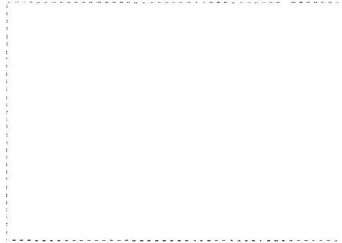
그림 1. 볼링 놀이

이 놀이는 몸 전체의 움직임 및 손과 발의 움직임을 다루며 자기 신체를 조작하는 놀이와 다른 물체나 소리, 움직임에 맞추어 조작하는 경우가 있다. 운동장애가 있는 아동은 먼저 자신의 몸을 어떤 방법으로든지 자유롭게 움직일 수 있는 통제 기능이 먼저 이루어져야 한다. 그리고 손과 발을 이용한 대근육 운동과 소근육 운동을 중심으로 자유로운 복합운동으로 나아간다. 따라서 놀이의 내용은 텅굴기, 네발 기기, 손과 발로 동작 흉내내기, 손으로 조작하기 등으로 구성된다.