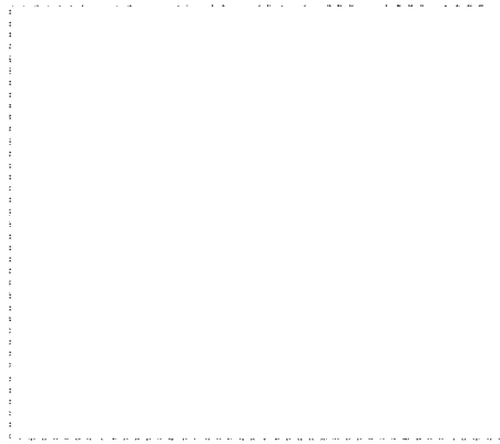
그림 4. 공치기

이 놀이는 몸의 평형 기능을 높이기 위한 것이다. 아동의 성장 과정에서 처음에는 누워있는 상태에서 두 발로 서기까지의 과정은 평형능력과 관계 있다.