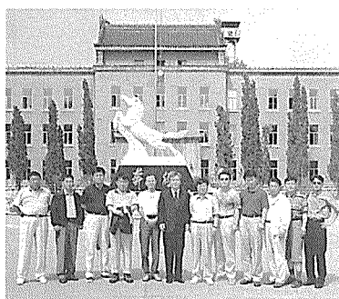
경북건축사회, 중국 연길시 방문

26일부터 30일까지 4박 5일의 일정으로 중국 연길시 중앙공산당건설국을 방문하고 돌아왔다. 경북건축사회 임원과 회원 10여명이 참여한 이번 방문을 계기로 향후 발전가능성이 무한한 중국연길시와 협력관계를 추진, 지속적으로 유대관계를 갖기로 했다.