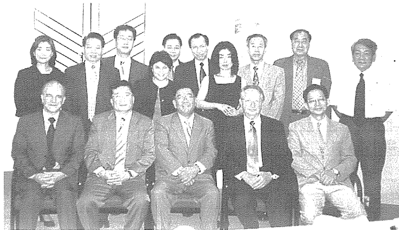
◀ 2001년 6개국 광산업협의회에 참석한 각국 대표들

○ 리나라를 포함한 6개국 광산업협의회가 내년 9월 서울에서 있을 예정인 2002국제광산업전시회 개최 기간중에 열린다.