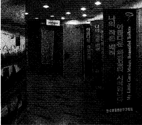
◀공청회가 개최되었던 한국관광공사 상영관 입구

② 시장·군수·구청장은 제2조제1항 내지 제2항의 규정에 의한 공중화장실 이외에 다수인이 항상 이용할 수 있는 장소와 시설의 화장실에 대하여 개방할 필요가 있다고 인정하는 경우에는 건축물의 소유자 또는 관리자와 협의하여 개방화장실로 지정할 수 있다.