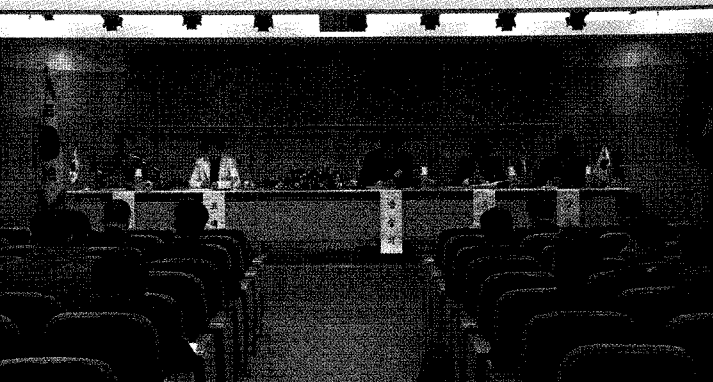
▲공청회에서 법률제정 필요성에 대한 주제발표를 하고있다.