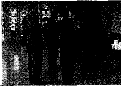
공청회 장소는 정보교환 및 비즈니스를 위한 장소역할도 한다.▶