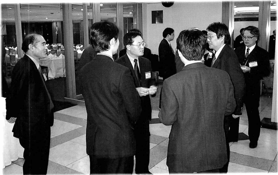
② 담소를 나누고 있는 각계 인사들