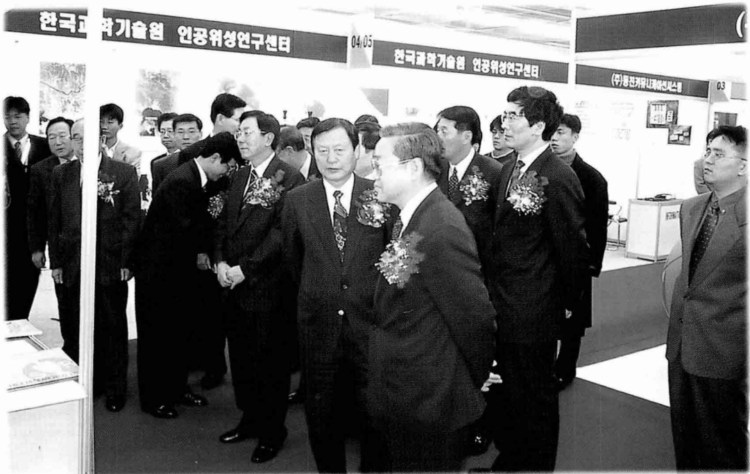
② 전시 부스 브리핑(1)