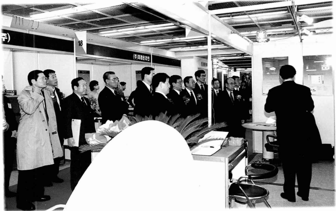
① 전시 부스 브리핑 (2)