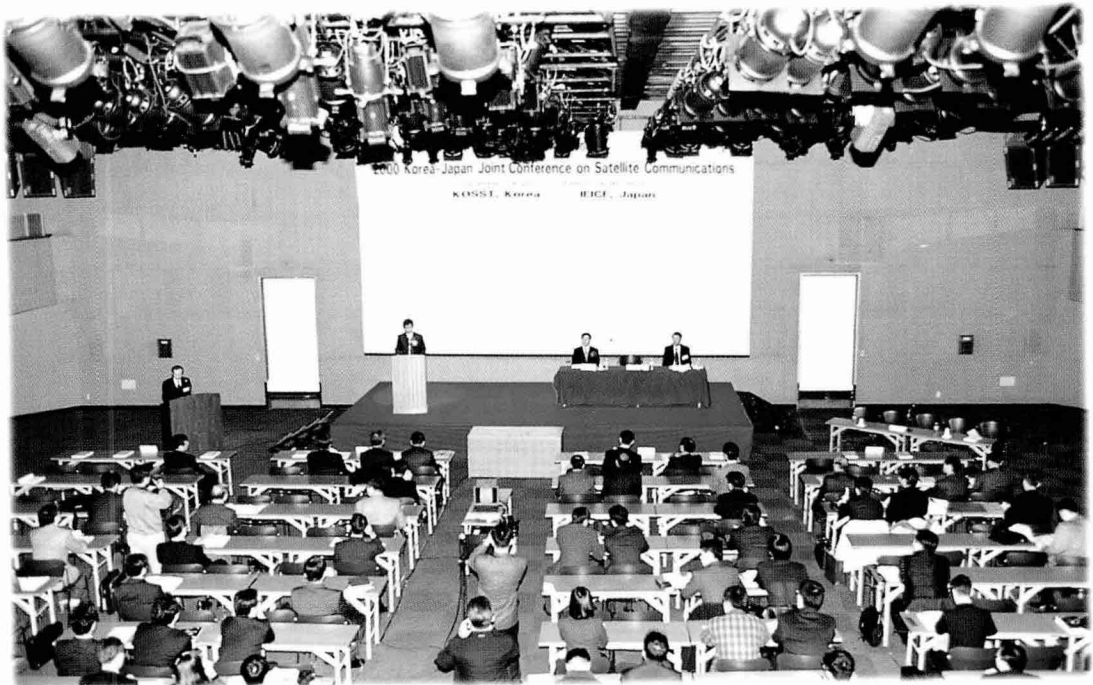
② 컨퍼런스 강좌 전경