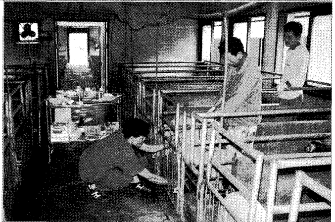
▲컨설턴트는 철저하게 컨설팅을 의뢰한 양돈가의 입장에서 모든 문제를 바라보고 해결하려는 노력을 하여야 할 것이다.

즉, 양돈가가 컨설팅을 의뢰하는 근본적인 목적은 경제적인 이윤 추구라고 볼 때 컨설턴트가 이와 같은 양돈가의 목적을 충족시켜 주지 않으면 제아무리 많은 노력을 하였다 하더