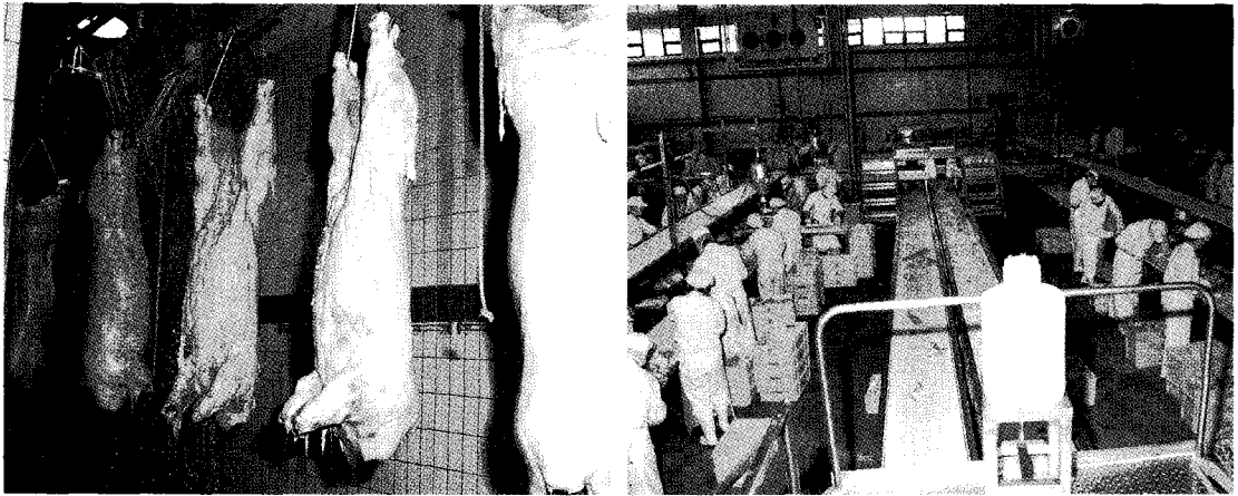
▲부경양돈 품질인증제도는 약 1년간의 홍보 및 준비기간을 거쳐 2000년 7월부터 본격적으로 시행한 제도이다.

한 요인중의 하나는 인증제도 도입 후 체계적이고 지속적인 관리를 하고 있다는 점이다. 특히 농장을 대상으로 지속적인 교육과 매월 농장별로 도체등급 분석, 육질등급 분석, 이상돈육 발생현황 분석 등을 통하여 농가가 직접 자신의 농장 상황을 정확하게 파악할 수 있도록 모든 자료를 공개하는 것이 큰 힘을 이루고, 또한 지속적인 관리를 위해 농장을 지도할 수 있는 전문인력을 확보하고 있다는 것이 강점이기도 하다.