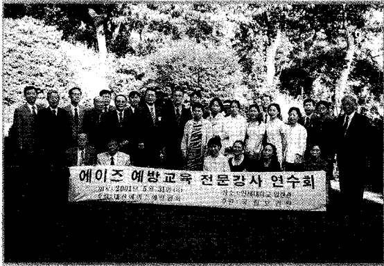
에이즈 예방교육 전문강사 연수회