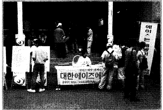
유엔 특별총회기념 길거리 에이즈 홍보