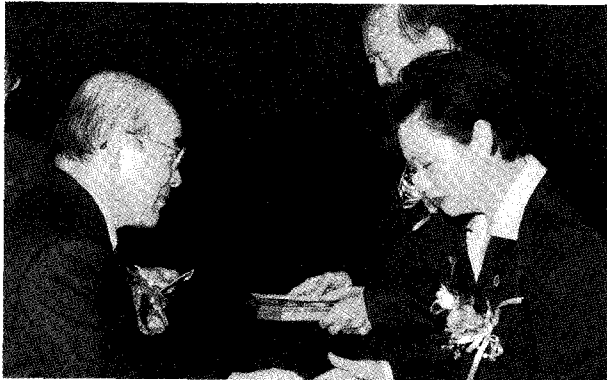
◀ 제18회 세계 결핵의 날 행사에서 복십자대상 시상 모습

제항결핵 및 폐질환 연맹의 후원하에 대한결핵협회는 매년 기념행사를 개최하여 결핵사업의 숨은 공로자에게 복십자대상을 수여하고 결핵과 관련하여 기