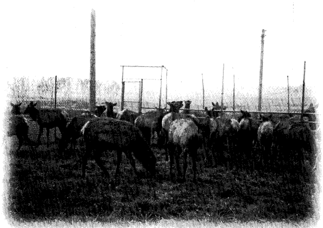
▲ 현금 비율이 높을 경우 대외 신용은 높으나 자금이 사장되는 결과를 초래한다

② 현금비율 : 이 비율은 1년이 내에 갚아야 할 부채에 비하여 현금이나 예금을 얼마나 보유하고 있는가를 따져봄으로써 농장이나 기업의 즉각적인 지급능력을 평가하는 지표로서