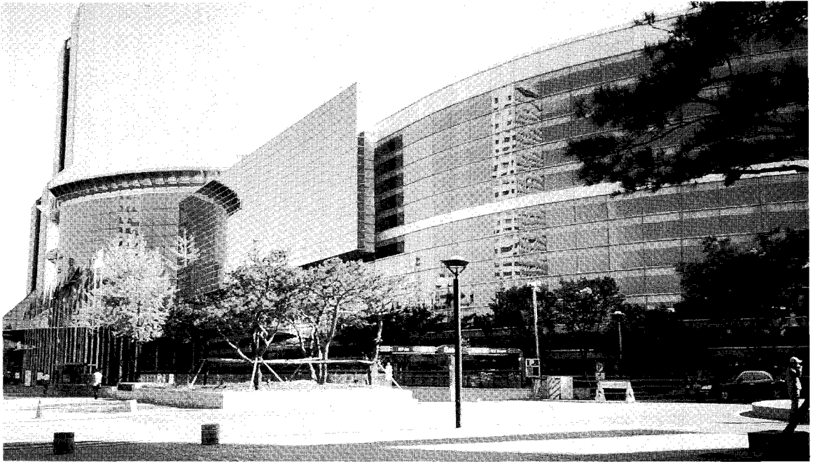
△2001 국제축산 박람회가 열릴 삼성동 코엑스(COEX)전경

홍보에 중점을 두고 국산 축산물의 차별화에 초점을 맞추어 축산 홍보관을 운영하게 되며 각 축종별로 환경친화적 축산업을 통한 위생적이며 안전성 있는 한국형 축산물의 생산에서 소비자에게 제공되는 과정을 전시할 계획을 세우고 있습니다.